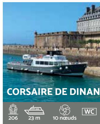
CORSAIRE DE DINAN