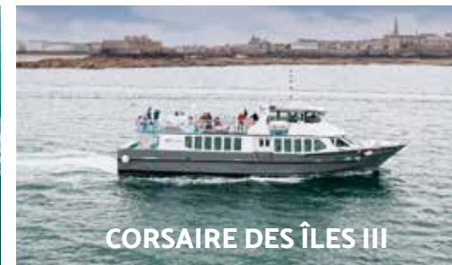
CORSAIRE DES ÎLES III