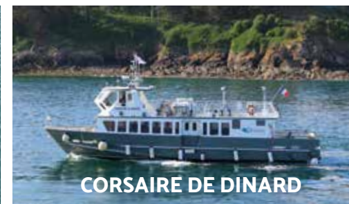
CORSAIRE DE DINARD