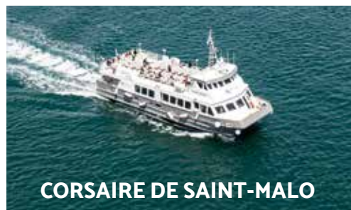
CORSAIRE DE SAINT-MALO