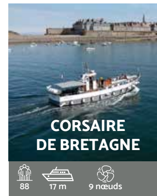
CORSAIRE DE BRETAGNE