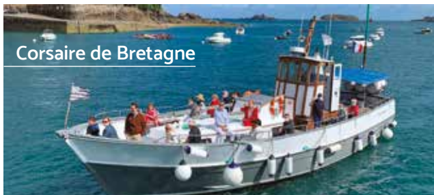
Bateau traditionnel Breton au charme rétro